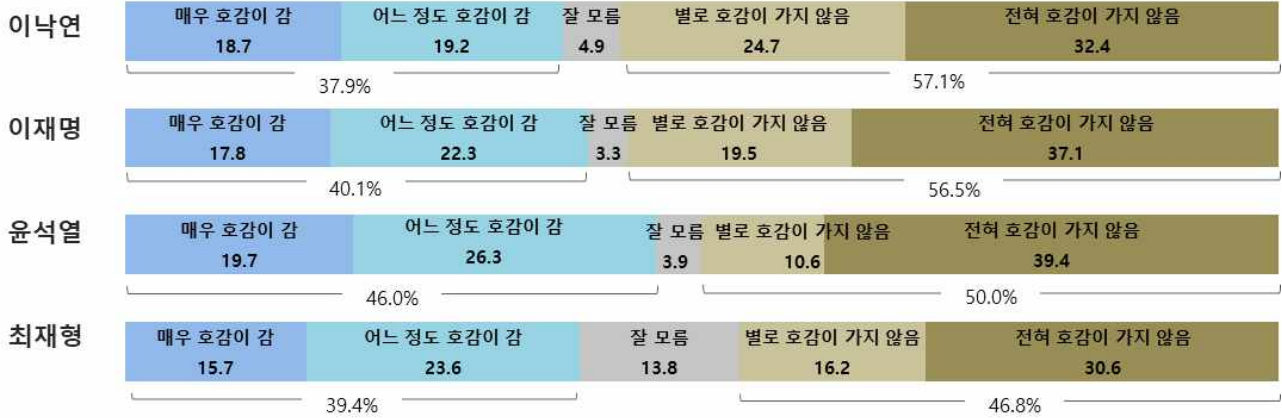
표1 > 이낙연 후보 호감도

문. 귀하께서는 이낙연 후보에 대해 지지와는 별개로 얼마나 호감이 가십니까, 또는 호감이 가지 않으십니까? (선택지 1~4 순/역순)